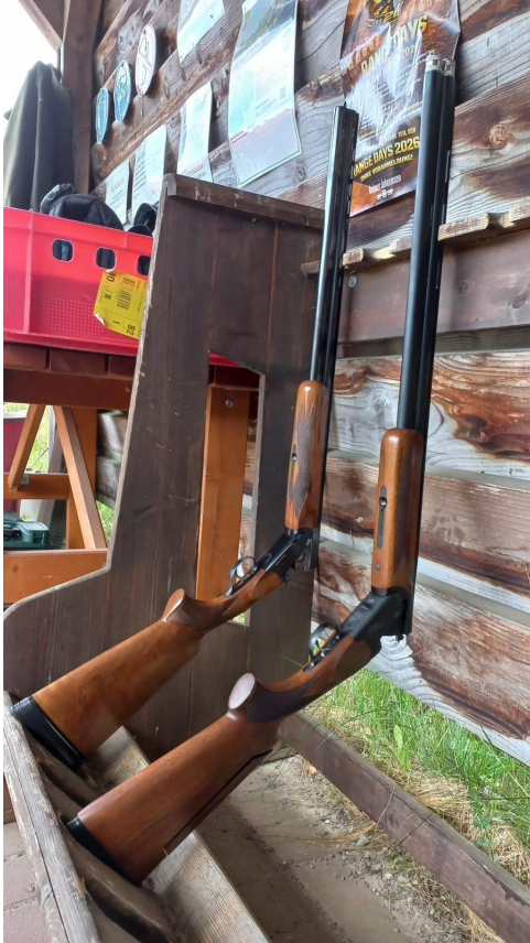
Das „Sportgerät“ beim Wurfscheibenschießen: die Bockdoppelflinte.

Gleich fliegt sie: Simon Denz in Erwartung der Wurfscheibe.