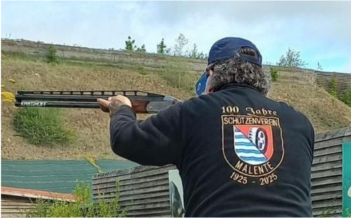
Verbindet Tradition und Moderne: der Schützenverein Malente.

101 Jahre ist der Schützenverein Malente bereits alt und steht von jeher für eine Verbindung von Tradition und Moderne. Deutlich wird das beispielsweise mit der Gründung der neuen Sparte „Wurfscheibenschießen“ im September des vergangenen Jahres – der ersten ihrer Art im Kreis Ostholstein überhaupt.