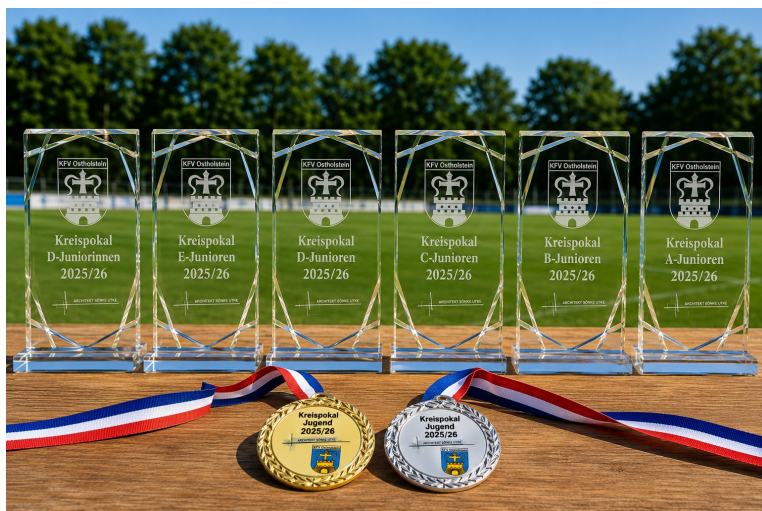
Attraktiven Jugendfußball sahen Fans und Offizielle am Pfingstmontag in Gleschendorf.