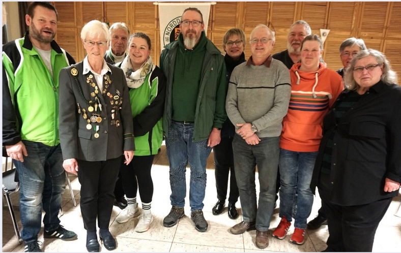
Der Vorstand des Kreisschützenverbandes OH.